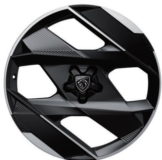
20 吋 GT RAPIDE 專屬 黑銀雙采鑽石切削鋁合金輪圈